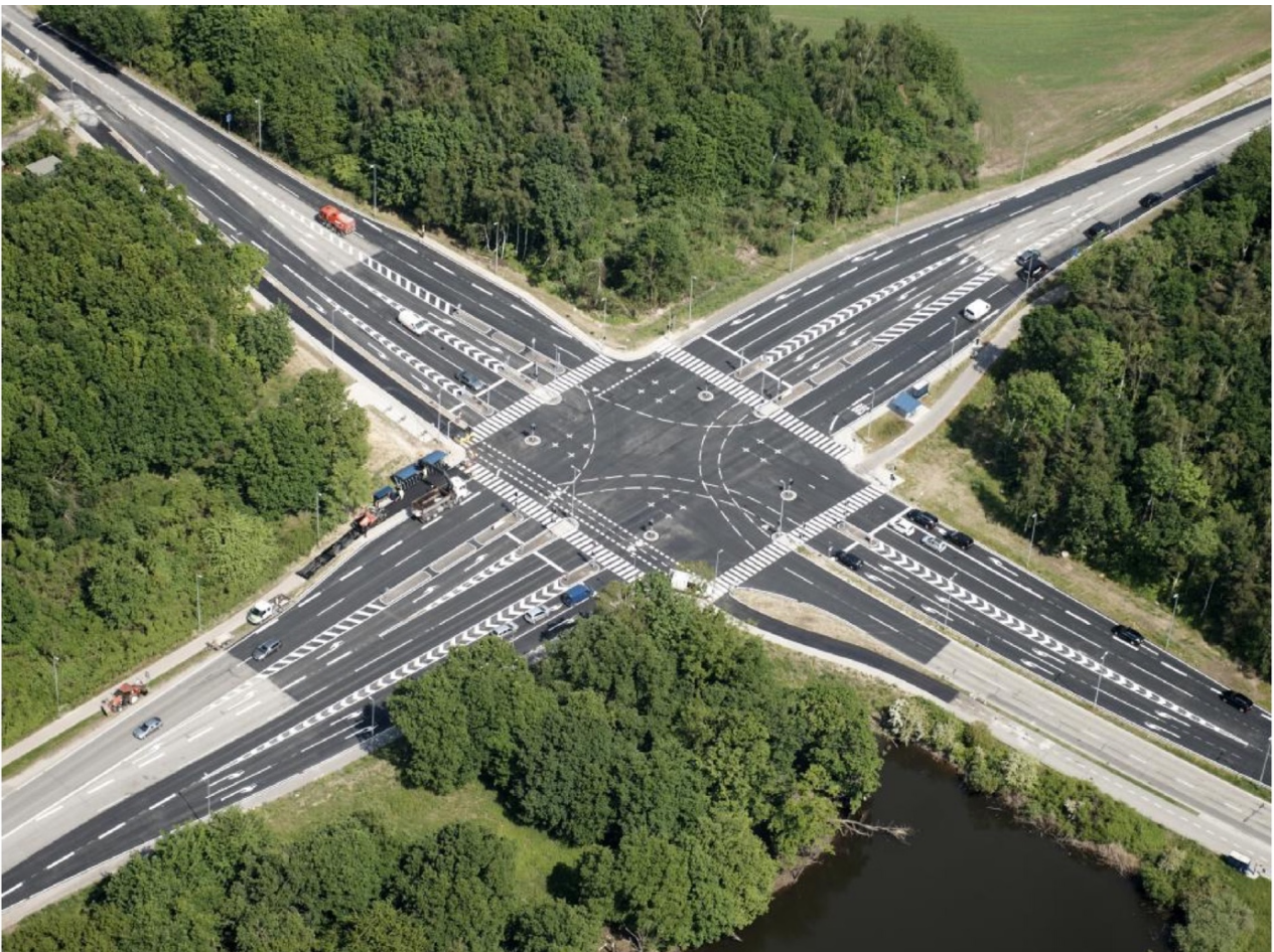
Klausdalbrovej, Ring 4, Ballerup

“Vi fandt en løsning på et problem der ville sætte os år tilbage i tidsplanen. Løsningen med DURAPOR® var nem at udføre og har nu ligget i flere år. Ingeniørfirmaet Sweco har løbende foretaget målinger op opbygningen og alle parter er meget tilfredse med løsningen. Gytje er en meget stor udfordring, men DURAPOR® kan løse gytje-problemer hurtigere og billigere.”